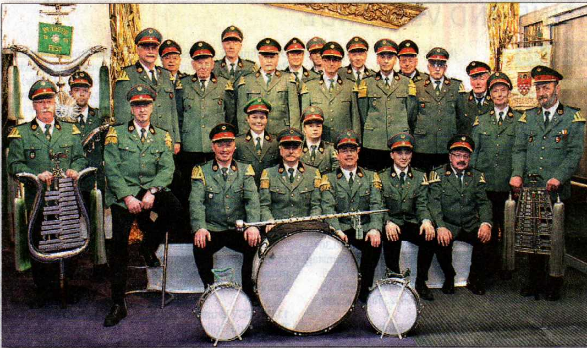
Ein Großteil der aktiven Mitglieder des IBSV-Spielmannszuges.